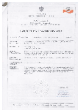
Spójność pomiarowa do wzorca państwowego