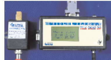
Spójność pomiarowa do wzorca państwowego