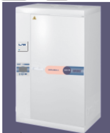
C- 200W wersja A