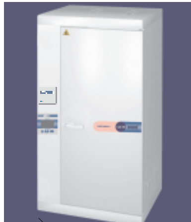
C- 140W wersja A