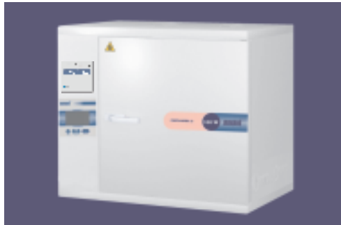
C- 100W wersja A